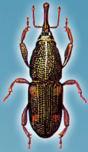
Sitophilus oryzae / Sitophilus zeamais (Caruncho-dos-cereais ou Gorgulho-do-arroz e Gorgulho-do-milho)