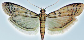
Ephestia cautella (Traça-do-cacau ou Traça-das-flores-do-coqueiro)