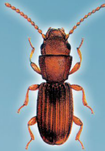
Cryptolestes ferrugineus (Besouro de diversos grãos)