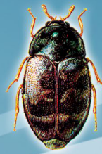
Trogoderma granarium (Besouro-do-arroz e outros grãos)