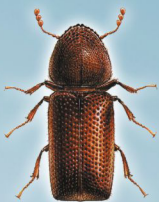
Prostephanus truncatus (Besouro-do-milho)