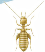
Liposcelis corrodens (Piolinho ou Liposcelis)