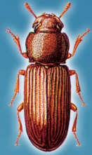
Tribolium castaneum (Besouro ou Besouro-castanho)