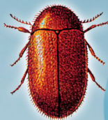
Lasioderma serricorne (Bicho-do-fumo ou Caruncho-do-fumo)