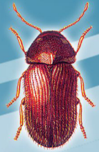
Stegobium penicum (Besouro)