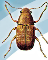
Araecerus fasciculatus (Caruncho-das-tulhas ou Caruncho-do-café)