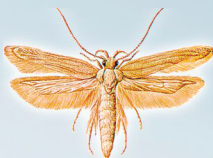
Sitotroga cerealella (Traça-dos-cereais ou Tínea-dos-cereais)