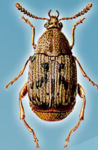
Acanthoscelides obtectus (Gorgulho-do-feijão ou Caruncho-do-feijão)